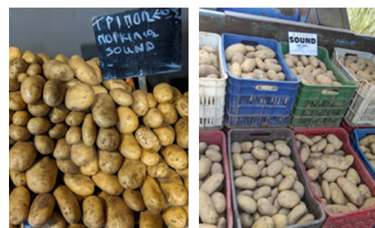
Kleine supermarkt in Tripoli, Peloponese, Griekenland

In Griekenland wordt Sound verkocht in supermarkten, groentespeciaalzaken en op lokale markten. "De vorm en de schilkwiteit van Sound worden in deze markten zeer gewaardeerd. Dit is vooral van belang voor kleinere winkels en markten waar aardappelen onverpakt worden gepresenteerd", vertelt onze partner Panos van GPK Agrohellas in Griekenland. "Wat we van klanten terugkrijgen, is de goede smaak van Sound en dat het ras heel geschikt is voor thuisfriet, maar ook om te bakken of te koken."