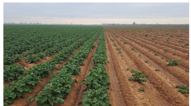
Lady Jane (links) vs Agria (rechts) op 14-3-2024

Buitenom Spanje, is Lady Jane ook geschikt voor andere vroege teeltgebieden in bijvoorbeeld Griekenland, Turkije, Frankrijk en Italië.